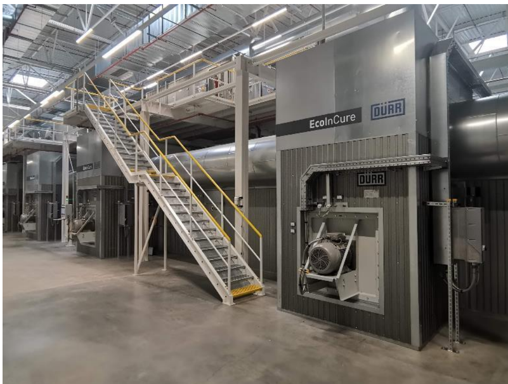
Zdjęcie nr 3: Układ zapewniający oszczędność miejsca: EcolnCure zmniejsza długość suszarki o połowę w porównaniu z suszarkami konwencjonalnymi.